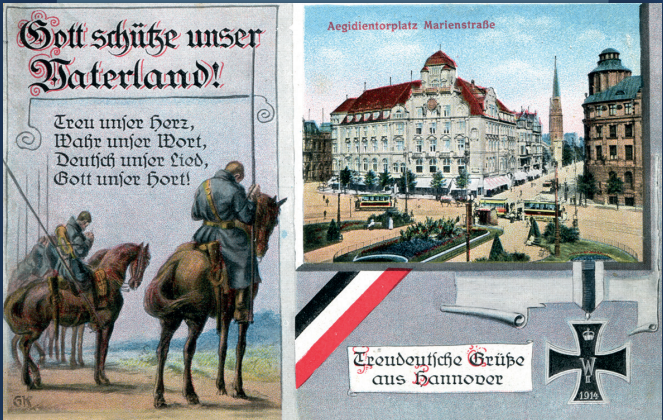
Hannoversche Postkartenpropaganda aus dem Ersten Weltkrieg

1914 begann der Erste Weltkrieg, die „Urkatastrophe des 20. Jahrhunderts“, wie der Historiker George F. Kennan schrieb. Der Krieg war jahrelang vorbereitet worden und Deutschland trug wesentliche Verantwortung für diesen ersten industrialisierten, totalen Krieg, in den die gesamte Bevölkerung einbezogen wurde.