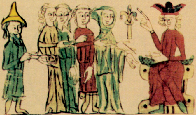
Gekennzeichneter „Schutzjude“ (links), Illustration aus dem Sachsenspiegel, 14. Jahrhundert

VERANSTALTUNGEN 29. OKTOBER BIS 3. DEZEMBER 2026