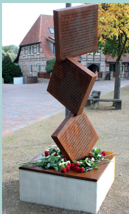
Holocaustmahnmal, Neustadt a. Rbge., Zwischen den Brücken

Erinnert wird an die Verfolgung, Vertreibung und Ermordung der Jüdinnen und Juden in Neustadt a. Rbge., an die Zerstörung der Synagoge in der Nacht vom 9. auf den 10. November 1938 und die Verbrennung der jüdischen Kultgegenstände zwischen den beiden Leinebrücken – an der Stelle, wo heute das Neustädter Holocaust-Mahnmal steht.