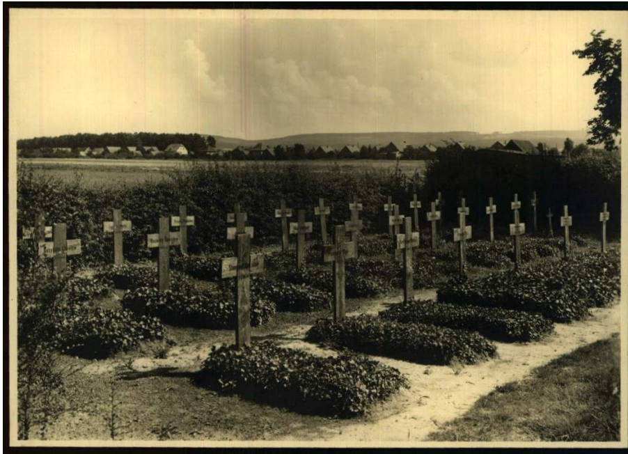
Historisches Foto des „Ostfriedhof“, undatiert 12

Nach Kriegsende waren noch ungefähr 35 polnische und sowjetische DPs in Steinhude in einem Lager gemeldet. Sie sollen im Februar 1945 von ihrem Sammelpunkt Strandhalle aus, in ihre Heimatländer transportiert worden sein. Außerdem gab es im Ort noch einige Heime, in denen ehemalige Häftlinge des KZ Bergen-Belsen gepflegt wurden. 13