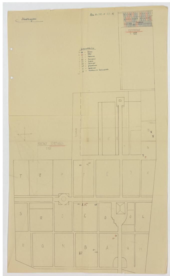
Historische Skizze des Stadthagener evangelisch-lutherischen Friedhofs mit Zwangsarbeitergräbern, undatiert 11